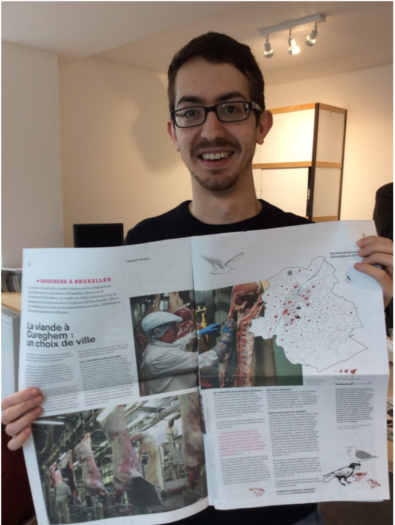
Bouchers à Bruxelles